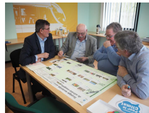
Jeu de construction d'une stratégie territoriale de sobriété énergétique Actions pour l'acculturation à la sobriété